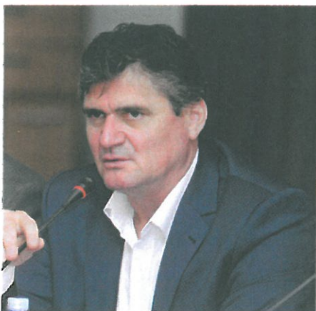
GRIGORE POP, director general ANRM

acceptului proprietarilor de teren mai sus menționat, sunt nevoiți să ducă negocieri cu aceștia, iar de multe ori, din cauza prețului foarte ridicat (5-10 lei/mp), acțiunea eșuează și activitatea de exploatare nu mai poate avea loc, deci nici reducerea veniturilor la bugetul de stat. Soluția – Legea minelor nr. 85/2003 cu modificările și completările ulterioare trebuie completată cu prevederea: exproprierea pentru utilitate publică a suprafețelor de teren unde urmează să se desfășoare activitate de exploatare a resurselor minerale naturale bunuri ale statului.”